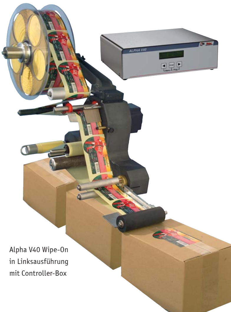
Alpha V40 Wipe-On in Linksausführung mit Controller-Box