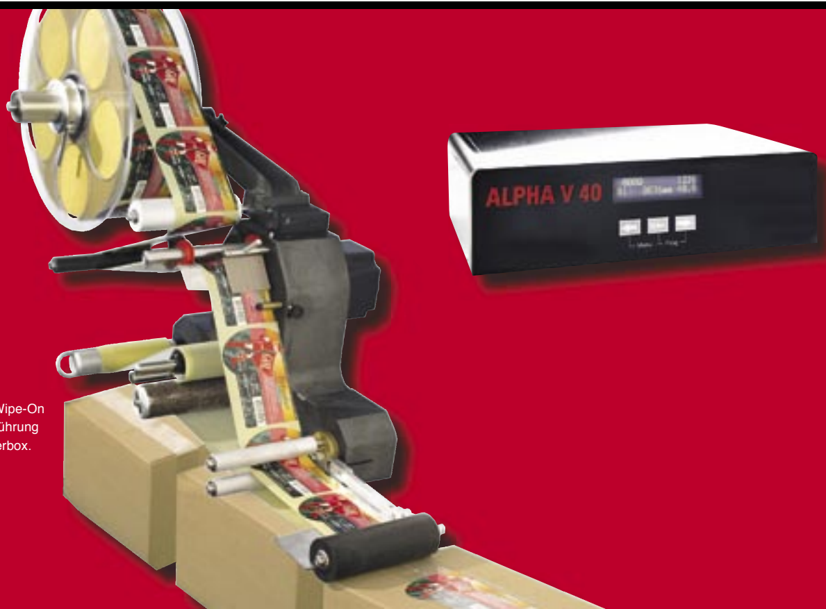
Alpha V40 Wipe-On in Linksausführung mit Controllerbox.

Die aktuelle Spendegeschwindigkeit wird in Meter pro Minute angezeigt und kann im laufenden Betrieb angepasst werden. Systemstörungen werden per Klartext im Display angezeigt.