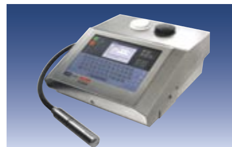
Inkjet-Klein-Codierer Linx 6800 zur berührungslosen Direktbeschriftung