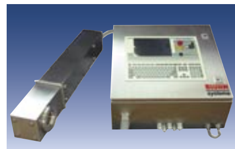
Laser-Codierer SolarJet HD blitzschnell schreiben mit Licht