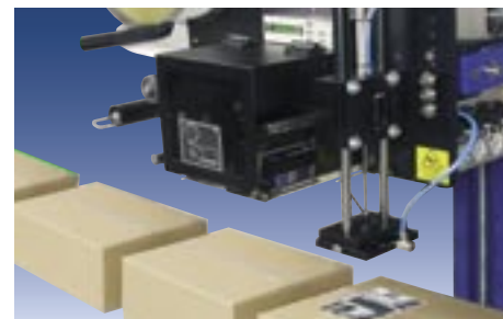
Etikettendruckspender Legi-Air 52xx Performance-Line für den Mehrschichtbetrieb