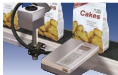
Digitaler Kartoncodierer Waxmark zur berührungslosen Codierung auf Wachsbasis

Technische Änderungen jederzeit vorbehalten.